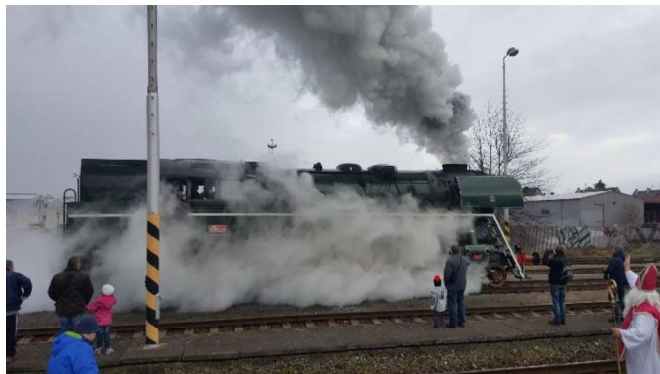
↑ podpora projektu Nostalgická Mikulášská jízda s Rosničkou DKV Olomouc