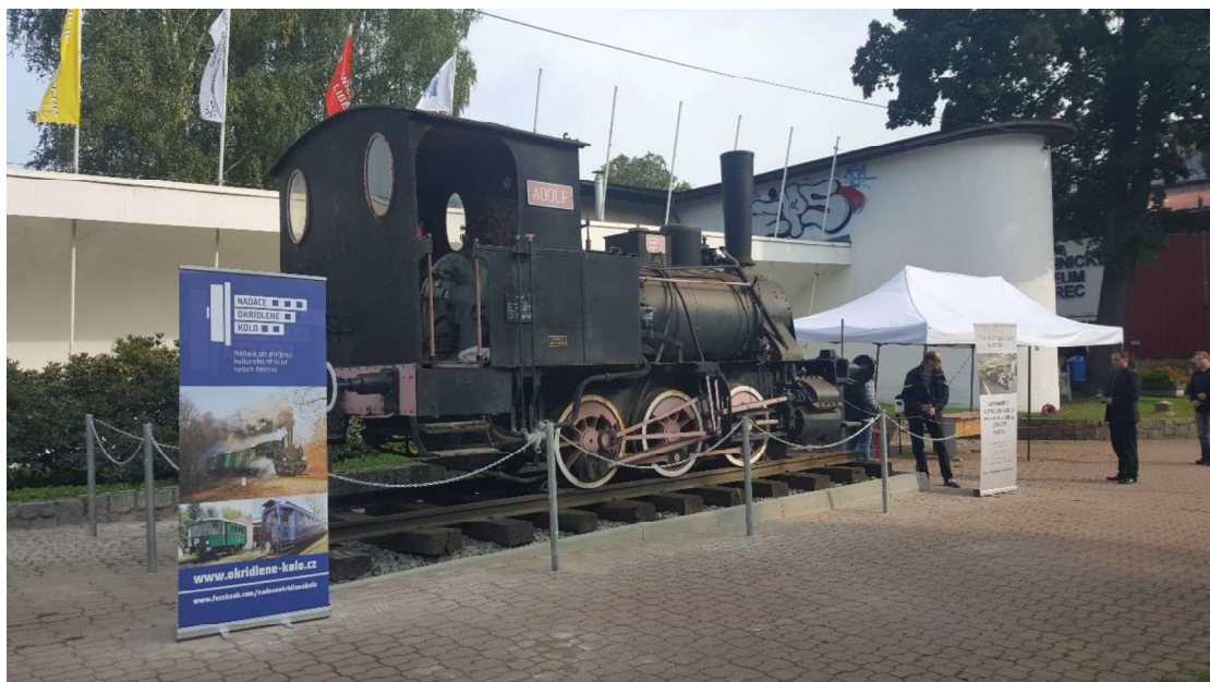
Foto akce NOK Hlavní nádraží Praha dne 8.2. 2018

Zapůjčená parní lokomotiva NOK „Adolf“ se v roce 2018 stala symbolem pro návštěvníky přímo před vstupem do areálu TM Liberec.