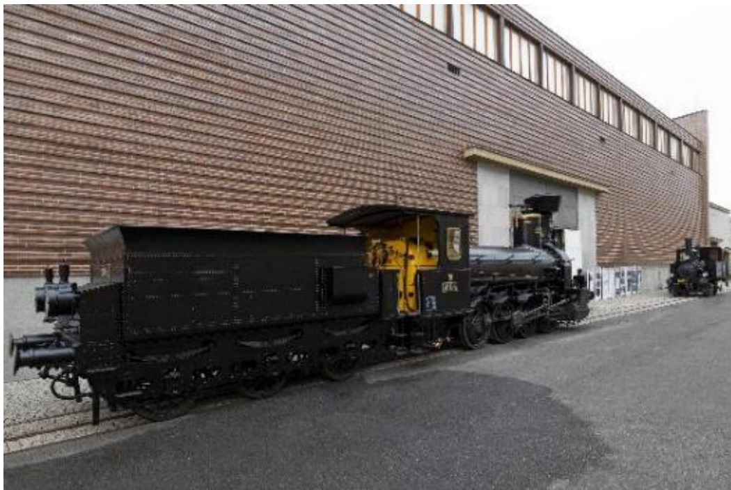
Restaurované lokomotivy v areálu NTM

Oprava třetí z lokomotiv projektu, parní lokomotivy 464.102 „Ušatá“, bude dokončena v letošním roce. Lokomotiva bude uvedena do plně provozního stavu.