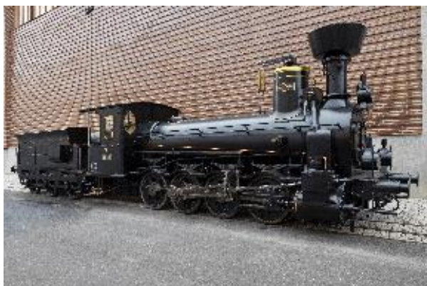
Nákladní parní lokomotiva 411.019 „Conrad Vorlauf“

KONTAKT PRO MÉDIA > JAN.DUDA@NTM.CZ > 220 399 189 > 770 121 917