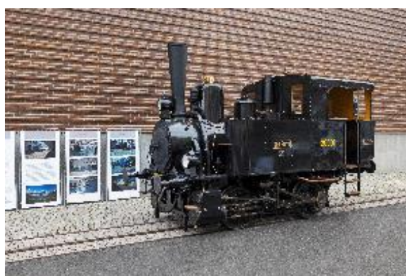
Tendrová parní lokomotiva 210.001 „Serényi“

Po prezentaci v areálu NTM v Praze na Letné budou lokomotivy v druhé polovině září 2023 uloženy a zpřístupněny veřejnosti v Železničním depozitáři NTM v Chomutově, který je pro návštěvníky každoročně otevřen od dubna do října.