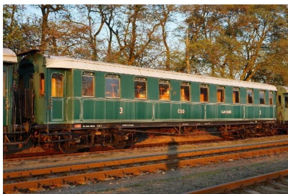
Fotografie před renovací