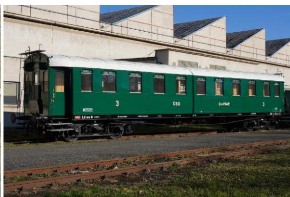
Fotografie po renovaci 11/ 2020